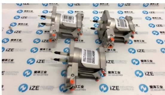
FISHER 阀门定位器 DVC6200 I/P 电气转换器（图 1, 2）