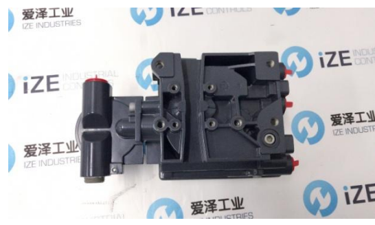
FISHER 阀门定位器 DVC6200 双作用带反馈（图 3,4）